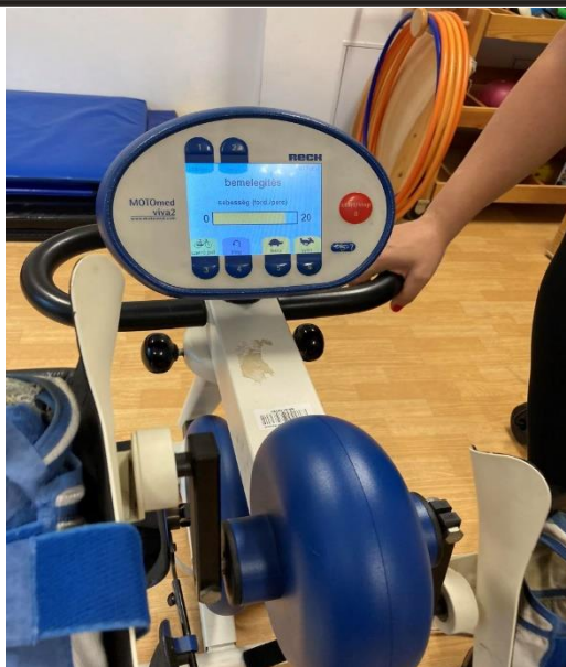
3.számú kép: Mozgásjavító Egységes Gyógypedagógiai Módszertani Intézmény, Óvoda, Általános Iskola, Gimnázium, Fejlesztő Nevelés-Oktatást Végző Iskola és Kollégium -MOTOMed eszköz