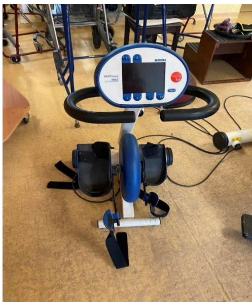
2.számú kép: Mozcássérült Embek Integrált Intézménye (MEREK) MOTOMed eszköz