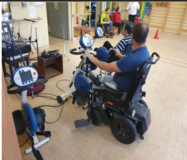
1.számú kép: Mozcássérült Embek Integrált Intézménye (MEREK) MOTOMed eszköz