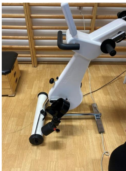
4.számú kép: Mozgásjavító Egységes Gyógypedagógiai Módszertani Intézmény, Óvoda, Általános Iskola, Gimnázium, Fejlesztő Nevelés-Oktatást Végző Iskola és Kollégium -MOTOMed eszköz